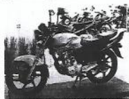
Moto em exposição em estande do Salão Deus Rodas, São Paulo, 2011.

7. Carlos adquiriu uma moto nas seguintes condições: uma entrada de R$ 2.000,00 mais uma única parcela de R$ 4.500,00, paga 2 meses após a compra. Sabendo que o preço à vista da moto é R$ 6.000,00, responda às questões: